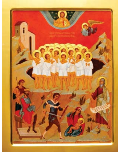
Вифлеемыште орландарен пуштмо йоча-влакын юмонашт

14 январь – Господьлан пүчмө йулам шуктымо кече. Святитель Василий Великийын кечыже.